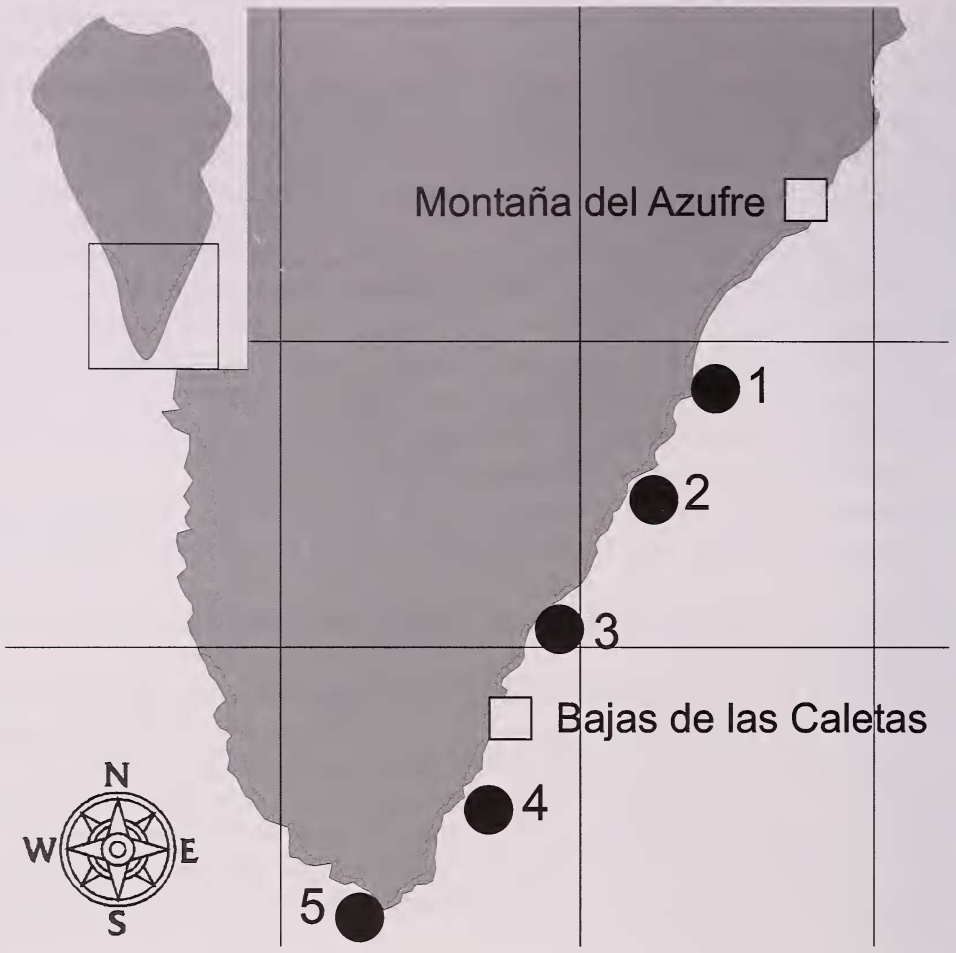
Fig. 1. Localidades donde fueron realizados los transectos. 1. Proís de Tigalate. 2. Playa del Río. 3. El Puertito. 4. Playa de Las Cabras. 5. Punta de Fuencaliente